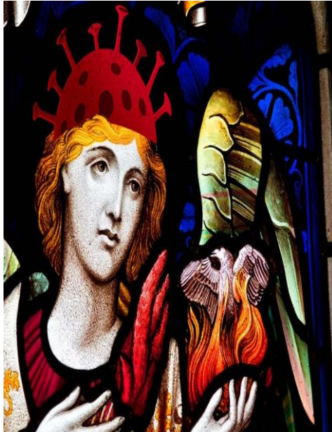
SLATE, "Is St. Corona Really the Patron Saint of Plagues?" (Erişim 24 Ocak 2022).