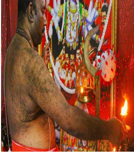
INDIA TODAY, "Man conducts daily pujas for 'Corona Devi' in Kerala".