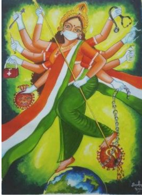
GALLERIST, "Maa Bharati On Coronavirus".