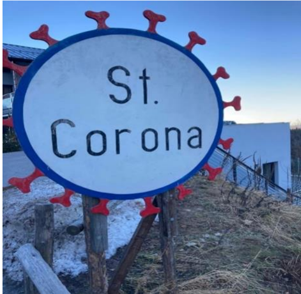
Şekil 10. Avusturya Sankt Corona am Wechsel'deki Tabela

Martina Wendelin, (Erişim 24 Ocak 2022).