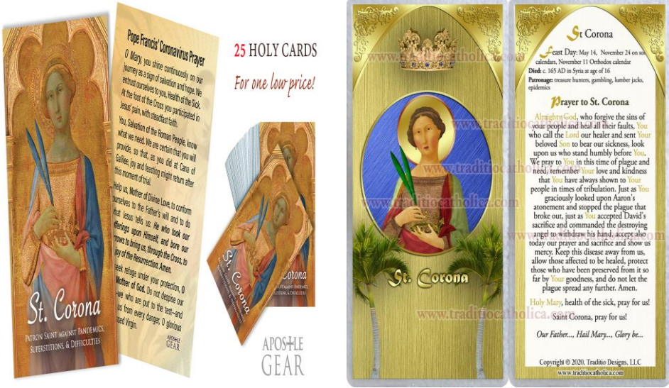
Şekil 7. St. Corona Temalı Dua Kartları

CatholicShop, "St. Corona Pandemic Prayer Holy Cards - 100-Pack" (Erişim 24 Ocak 2022); Etsy, "Saint St Corona, now patron of pandemics - Eastern Orthodox Catholic laminated Holy Prayer card. Available in two versions".