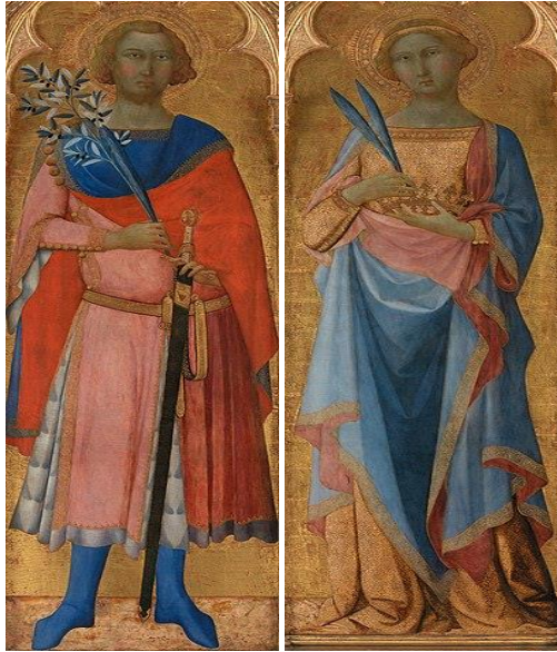
Şekil 18. St. Victor ve St. Corona

Bir Roma askeri olan St. Victor, belinde kılıcı ile; Victor ile beraber şehit olan St. Corona ise elinde ‘şehitlik coronasını’ yani şehitlik tacını tutar vaziyette tasvir edilmiş. Palazzo Venazia Madanno’nun eseri, National Gallery of Denmark (Wikipedia, “Victor and Corona” Erişim 24 Ocak 2022).