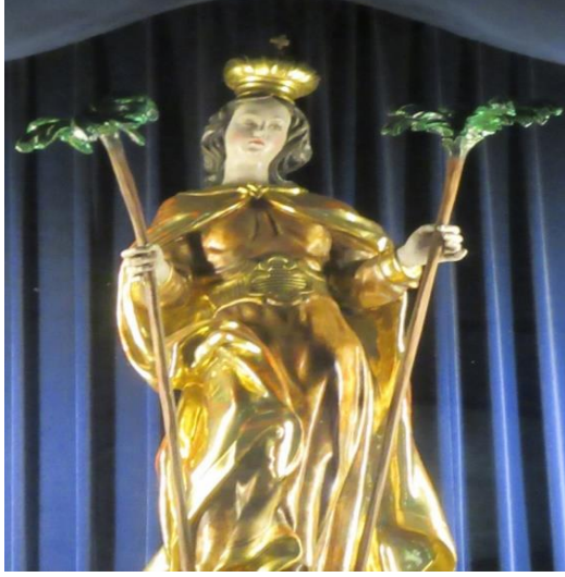
Şekil 21. St. Corona Heykeli

am Wechsel'deki kilisede bulunan, iki elinde kendisini şehit eden palmye ağaçlarını tutan, oduncuların koruyucu azizesi St. Corona (Ökumenisches Heiligenlexikon, "Corona").