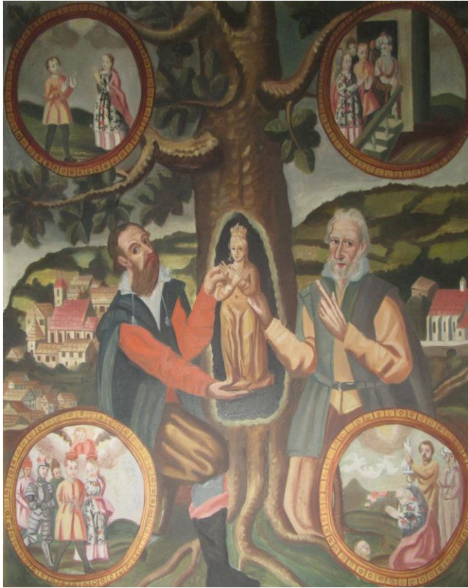
Şekil 20. St. Corona Heykelinin Keşfi

Ihlamur ağacı içerisinde St. Corona heykelinin keşfini canlandıran bir tablo (Ökumenisches Heiligenlexikon, “Corona”).