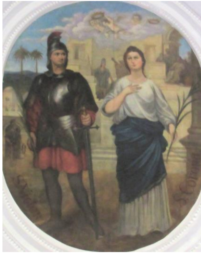
Şekil 14. St. Victor ve St. Corona

St. Corona am Wechsel bölge kilisesindeki St. Victor ve St. Corona'yı yan yana gösteren bir fresk. St. Victor asker kıyafetleri içerisinde ve adı gibi muzaffer bir asker pozunda; St. Corona, sol elinde bir palmiye dalı tutuyor. Arkada ise palmiye ağaçları ve gökte iki taç taşıyan melekler seçiliyor. (Ökumenisches Heiligenlexikon, "Corona").