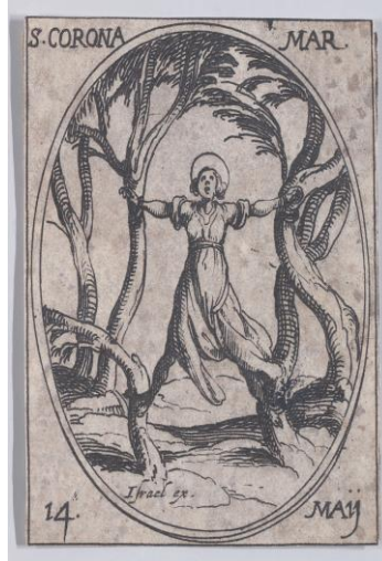
Şekil 12. St. Corona'nın Şehit Edilişini Konu Alan Oval Sahne

Palmiye ağaçları arasına bağlanan St. Corona'nın şehit ediliş günü olan 14 Mayıs ibaresinin eklendiği, "Saint Corona, Martyr" başlıklı bir çizim (THE MET, Met Museum. "Ste. Couronne, martyre (St. Corona, Martyr), May 14th, from Les Images De Tous Les Saints et Saintes de L'Année (Images of All of the Saints and Religious Events of the Year)", Erişim 24 Ocak 2022).