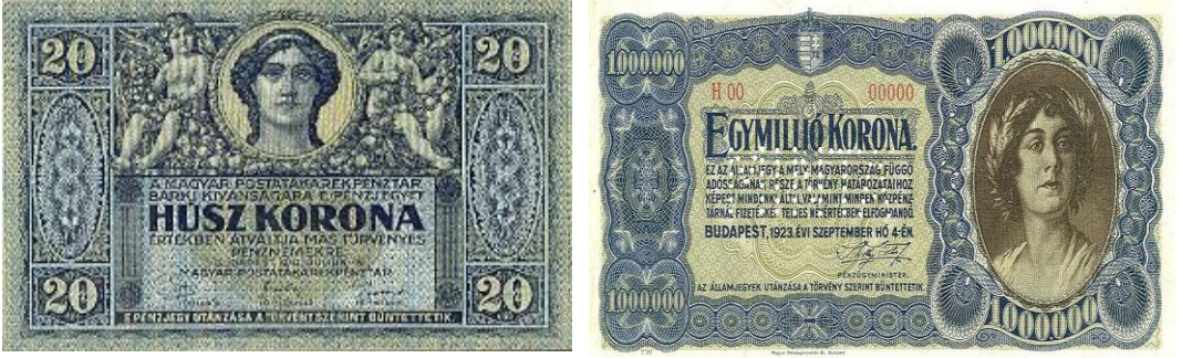
Şekil 19. Avusturya-Macaristan “Koronaları”

Wikipedia, “Avusturya-Macaristan Kronu” (Erişim 24 Ocak 2022).