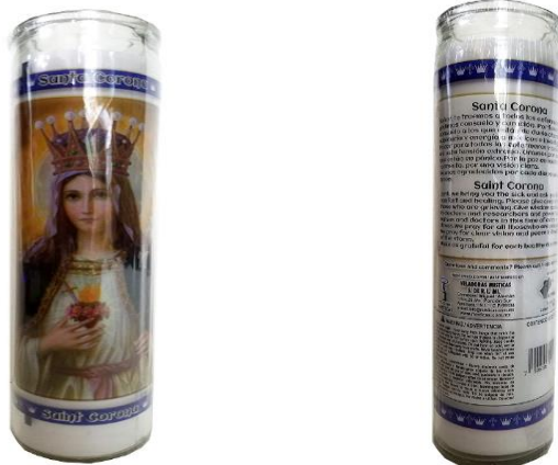
Şekil 8. St. Corona Adak Mumu

Amazon, "Staci19 Saint Corona (Santa Corona) Devotional Candle" (Erişim 24 Ocak 2022).