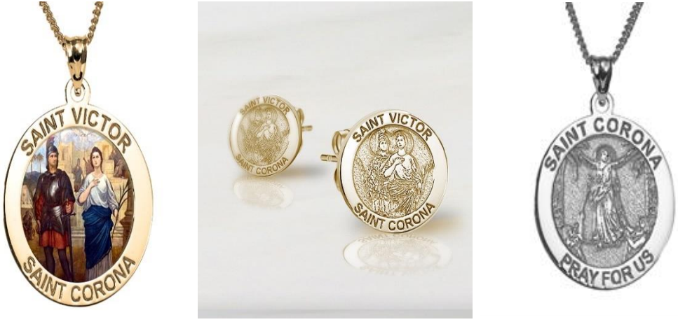
Şekil 17. Küpe ve Madalyonlar

St. Victor ve St. Corona temalı madalyon ile küpe ve St. Corona temalı, “St. Corona Bize Dua Et” ifadelerini taşıyan bir madalyon (PicturesonGold, “Saint Victor and Saint Corona Color Religious Medal ‘EXCLUSIVE’, ‘Pair of Saint Victor and Saint Corona Earrings’, ‘Saint Corona Religious Medal ‘EXCLUSIVE’”, Erişim 24 Ocak 2022).