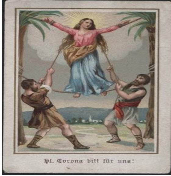
Moll, "Saint Corona, Saint Against Pandemics?".