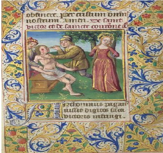
Şekil 16. St. Victor'un Çilesi

St. Victor'un, infazından önce gözlerinin oyulmasının canlandırıldığı bir minyatür. Yan tarafta ise ayakta iki ağaç arasında denk gelecek bir hizada dikilen St. Corona (Wikipedia, "Illuminated miniature of the martyrdom of Saint Victor and Saint Corona, on a full leaf from a Book of Hours, France (Paris), ca. 1480", Erişim 24 Ocak 2022).