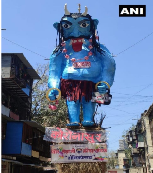
Hindistan/Mumbai'de Holi festivalinde yakılan CoronAsur maketi (ANI'den aktaran Rashmi Shetty, "Coronasur: A Double-layered Iconoclasm").