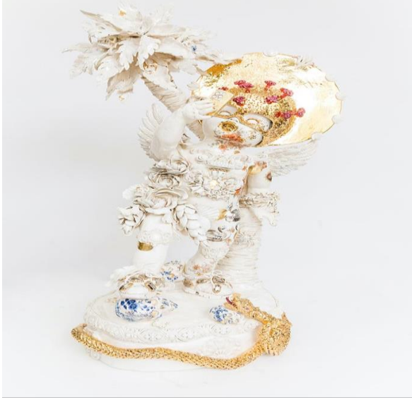
Şekil 15. Modern Bir St. Corona Heykeli