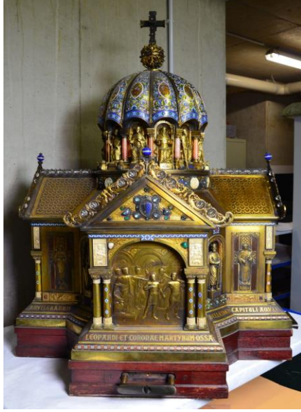
Şekil 9. St. Corona Relikleri Sandukası

Aechen Katedrali'nde bulunan ve St. Corona'ya ait kalıntıları ihtiva ettiği iddia edilen sanduka (Valentina Di Liscia, "The True Significance of St. Corona, the Viral Saint", Erişim 24 Ocak 2022).