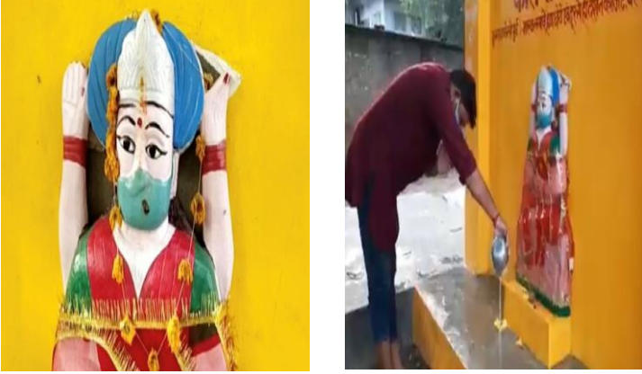
Şekil 1. Corona Mata

Hindistan/Uttar Pradeş Eyaleti'nden yeşil maskeli Corona Mata (Corona Tanrıçası) ve Corona Mata önünde tapınan bir dindar (REUTERS, "Indian village prays to 'goddess corona' to rid them of the virus" Erişim 24 Ocak 2022).