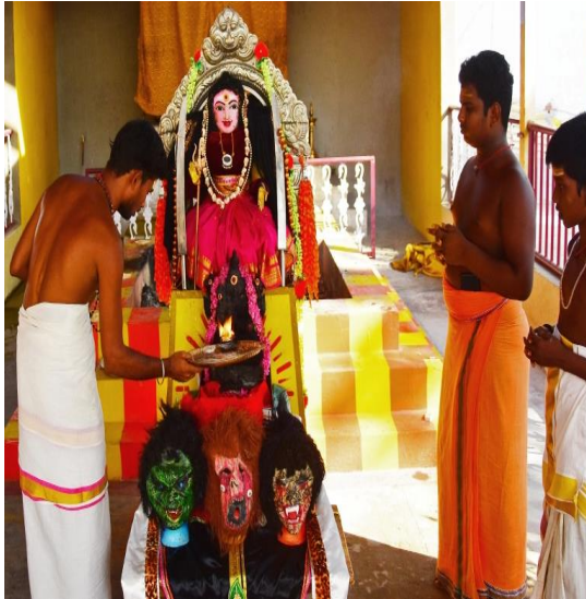
Şekil 2. Corona Devi

Kamatchipuri Adhinam tapınağında 'Corona Devi' önünde dua eden Hintli rahipler. Hindistan/Tamil Nadu Eyaleti (ALJAZEERA, "Corona Devi": Indian priests pray for mercy from COVID 'goddess").