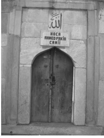
Res.1: dış kapı