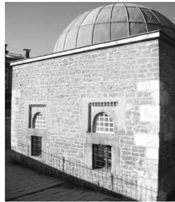
Res.24: Karatay Mescidi pencereleri