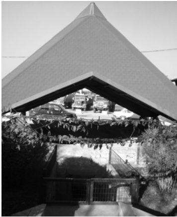
Res.23: Türbenin son hali