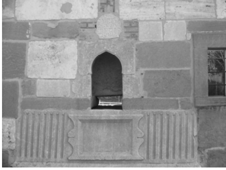
Res.3: Sebیل nişi