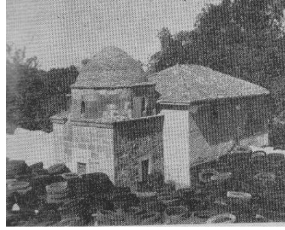
Res.8: Türbe ve mescidin eski fotoğrafı