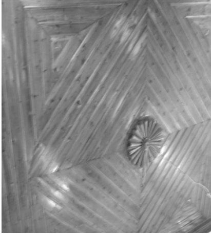
Res.15: Ahşap tavan