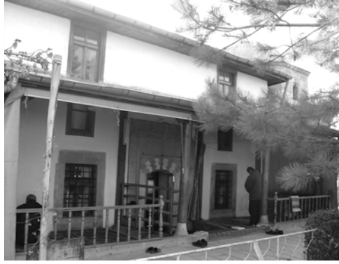
Res.10: Kapı ve pencereler