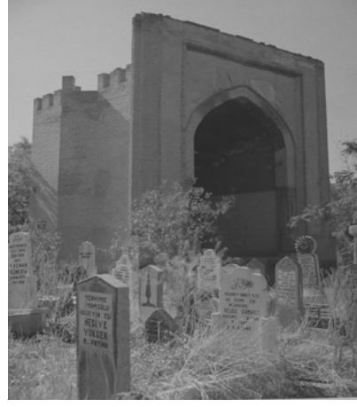
Res.20: Gömeç hatun