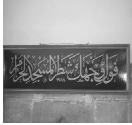
Res.14: Kible ayeti