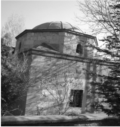
Res.17: Kubbe kasağı