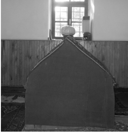
Res.19: Tahta sanduka