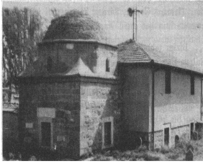
Res.7: Güneydeki mezarlar