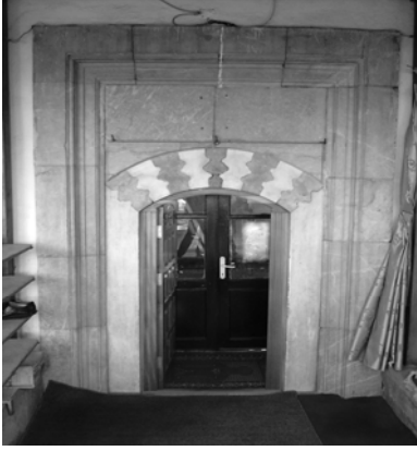
Res.9: Caminin giriş kapısı