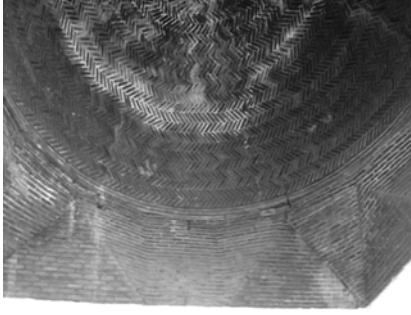
Res.25: Karatay Mescidi kubbe detayı