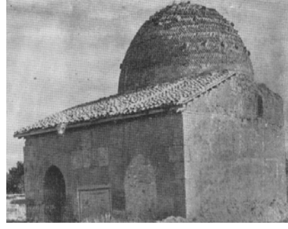
Res.28: Karatay Mescidi son cemaat yeri