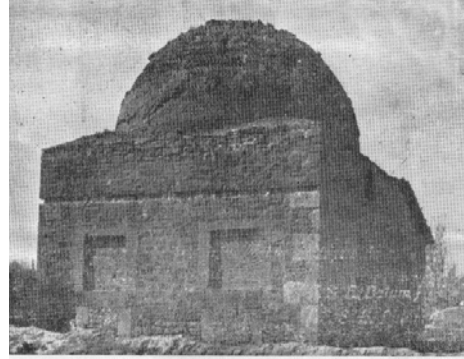
Res.26: Karatay Mescidi dış yüzeyi