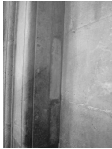
Res.12: Mihrap mermeri