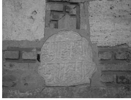
Res.4 :Üzerinde Hadis olan kitabe