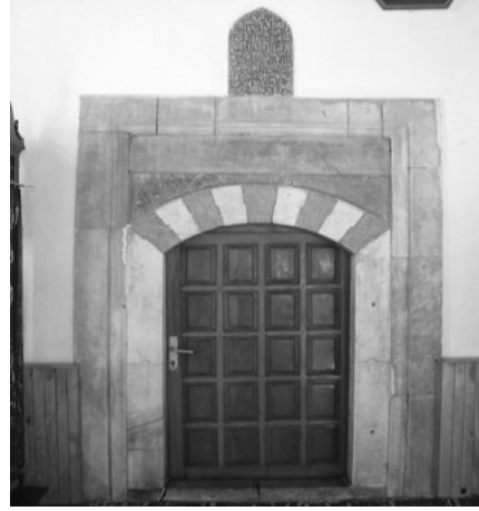
Res.16: Türbe kapısı