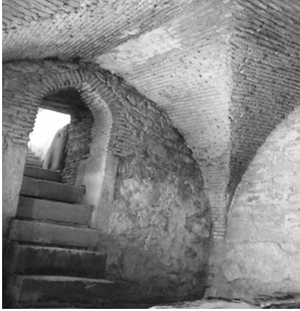
Res.21: Mahzen merdivenleri