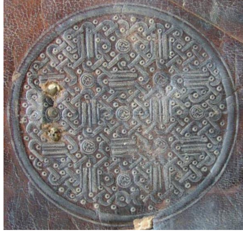
Fotoğraf 26-27: İnebey YEK Hüseyin Çelebi: 641, Arka kapak ve şemsesi