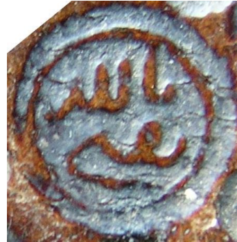
Fotoğraf 28-29: İnebey YEK Hüseyin Çelebi: 641, Şemseden detay ve mühür