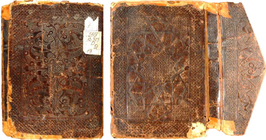
Fotoğraf 3-4: Ön kapağı rûmî ve arka kapağı geometrik tezyînatlı, miklebli Selçuklu cildi (Mevlânâ Müzesi Müzelik Eserler Kütüphanesi: 2109)

Genellikle kodeks formda üretilmiş Orta çağa ait Anadolu İslâm yazmaları, miklebli cildlerle kaplanmışlardır. Miklebsiz örnekleri de mevcuttur. Genellikle işlenmiş keçi derisi olan sahtiyanlarla kaplı bu cildler kahverengi ve tonlarında renklere sahiptir. Tezyînatlarında büyük oranda geometrik ve rûmî desenler tercih edilmiştir. Ancak 14. yüzyıldan itibaren hatâî, yaprak ve gongagülleri içeren bitkisel tezyînat da sıklıkla kullanılmıştır.