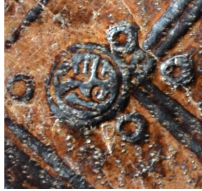
Fotoğraf 17-18: Yusuf Ağa YEK: 4739, Kapak köşelerindeki "Sikatî billah" yazılı mühürler