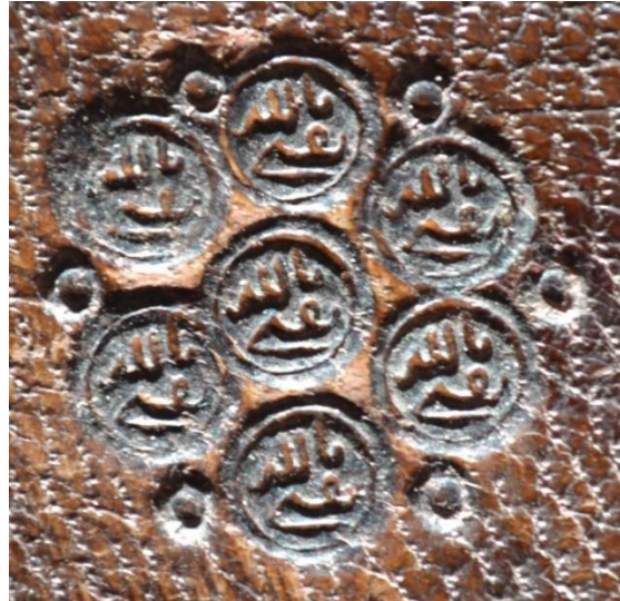
Fotoğraf 19-20: Yusuf Ağa YEK: 4739, Mikleb ve üzerindeki "Sikatî billah" yazılı mühürler