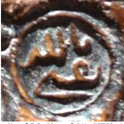
Fotoğraf 30: Yusuf Ağa YEK: 4739

Arapça bir isim cümlesi olan “Sikatî billah” (تقتي بالله) ibaresi “Güvenim Allah’adır” anlamına gelmektedir. “Sika” kelimesi, cümlenin mübtedası iken “billah” kısmı cümlenin haberi konumundadır. Tespit edilen mühürlerin tümünde, “billah” ibaresi mübtedanın üstüne yazılmıştır. Arapça bir isim cümlesinde haberin takdimi yani öne alınması, anlamın belli bir ögeye tahsis edilmesi ve vurgu gayelerine hizmet edebilirken 23 bu ifadede Lafzatullah (الله)’ın yukarıda yer almasının nedeni Hüsn-i Hat sanatındaki Lafzatullah ibaresini edeben istifin üstüne yerleştirme geleneğidir.